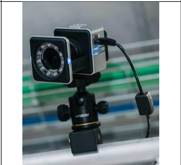
Telecamera di tracciamento del movimento