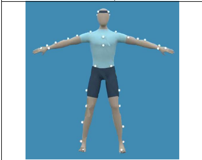
Vicon Nexus marker placement