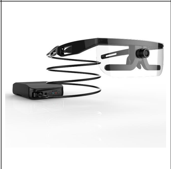
Sistema di eyetracking